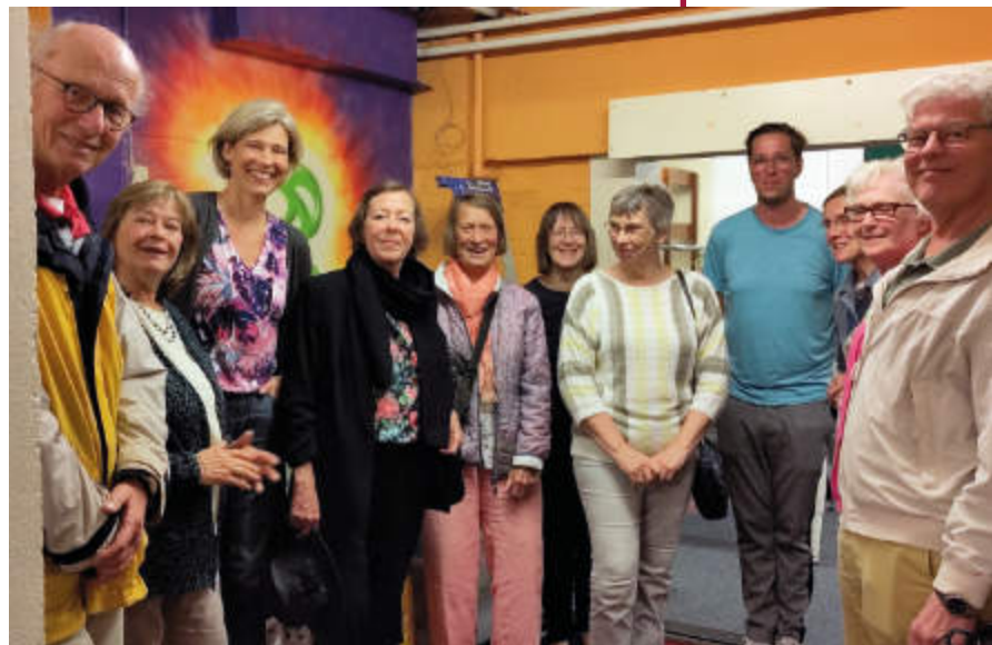
Foto onder: Kloosterkerkers in het Tienerrestaurant