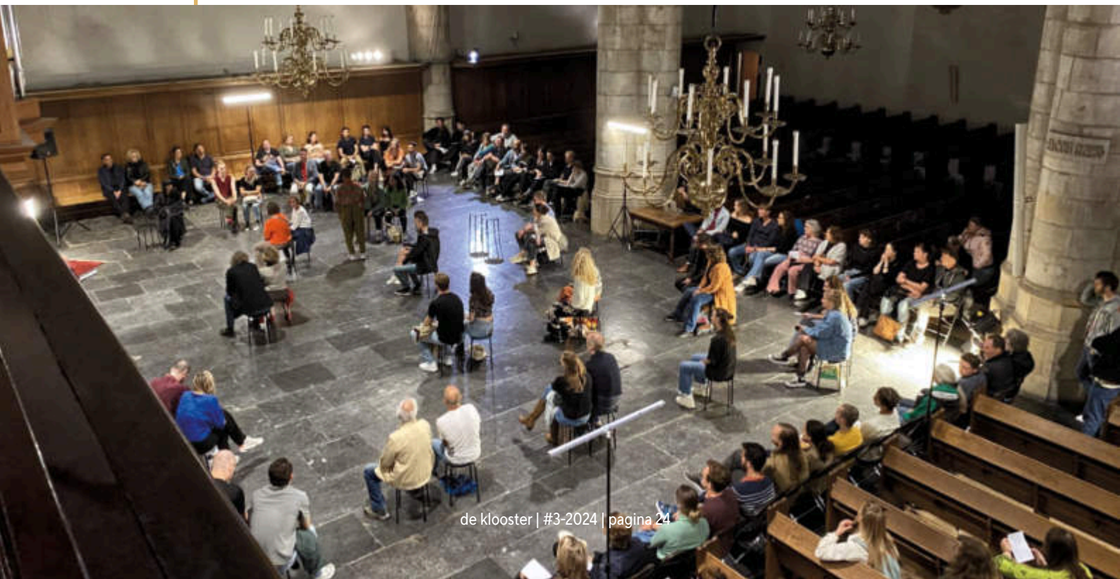
Foto: de Kloosterkerk tijdens Museumnacht

De portefeuille Open Kerk is behoorlijk gevuld. Gelukkig hebben mijn voorgangers alles goed georgani-