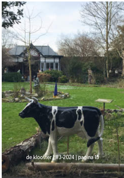
de klooster | #3-2024 | pagina 13