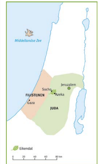
Het Eikendal lag tussen de steden Socho en Azeka.